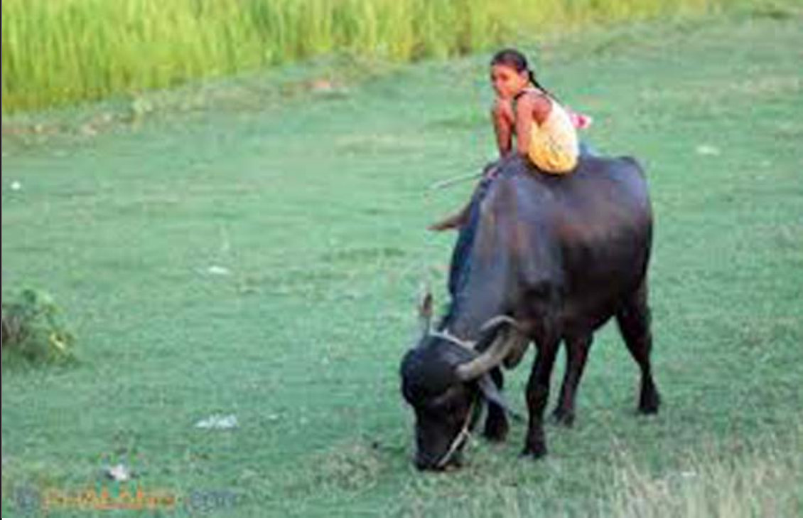
इस्कूल पढेके समय भैसी चरारहल बालिका, काहाँ गेल बाल अधिकार